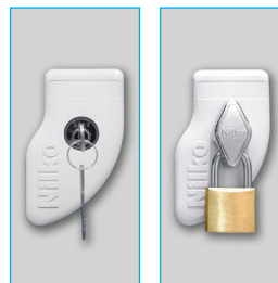
Llave escritorio - Porta candado (Candado diámetro entre 6 a 8 mm.)