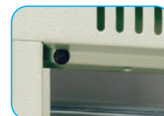
Refuerzo en puertas y tapón de goma