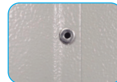
Remaches alojados para mejor acabado