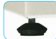
Pie elevador regulable