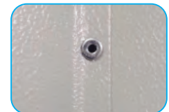
Remaches alojados para mejor acabado