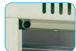
Refuerzo en puertas y tapón de goma