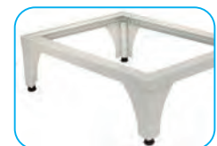
Base elevadora (opcional)