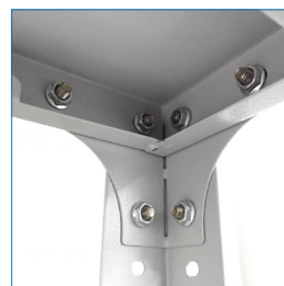
Escuadra de refuerzo en vértices