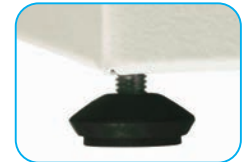
Pie elevador regulable