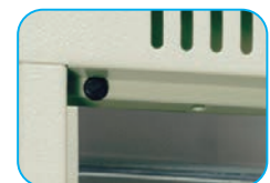
Refuerzo en puertas y tapón de goma