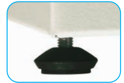
Pie elevador regulable