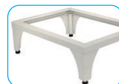
Base elevadora (opcional)