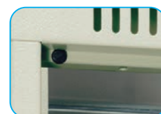
Refuerzo en puertas y tapón de goma