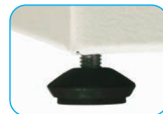
Pie elevador regulable