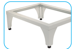
Base elevadora (opcional)