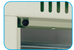
Refuerzo en puertas y tapón de goma