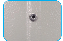
Remaches alojados para mejor acabado