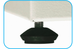
Pie elevador regulable