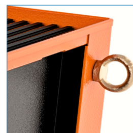
4 mirillas para fijación de la caja