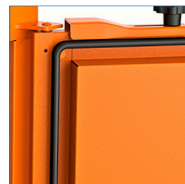
Puerta frontal con goma de obturación contra el polvo y agua.