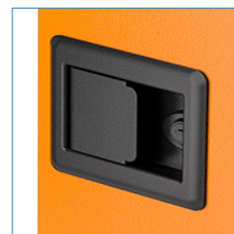
Cerradura reforzada con llave