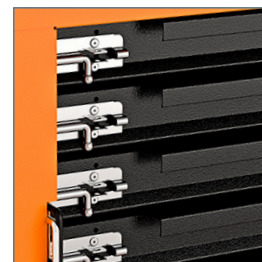
Rieles telescópicos para mayor apertura de los 5 cajones - Seguro metálico