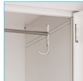
Barra colgadora - Colgador - Bandeja