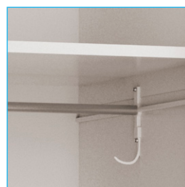
Barra colgadora - Colgador - Bandejas