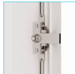
Cerradura triple bloqueo