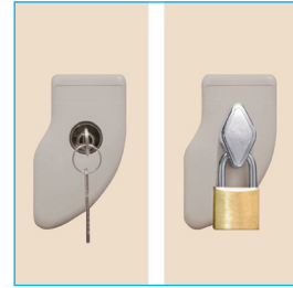
Llave escritorio - Porta candado (Candado diámetro entre 6 a 8 mm.)