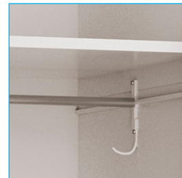
Barra colgadora - Colgador - Bandejas