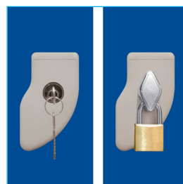
Llave escritorio - Porta candado (Candado diámetro entre 6 a 8 mm.)