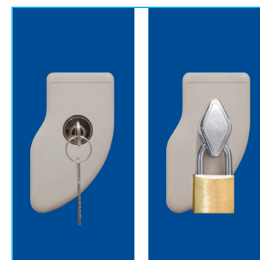
Llave escritorio - Porta candado (Candado diámetro entre 6 a 8 mm.)