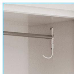
Barra colgadora - Colgador - Bandejas