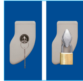
Llave escritorio - Porta candado (Candado diámetro entre 6 a 8 mm.)