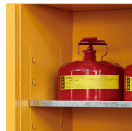
Bandejas regulables con soportes soldados