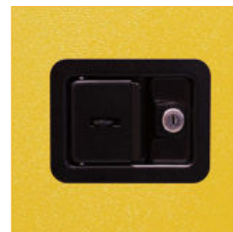
Cerradura de seguridad de 3 puntos