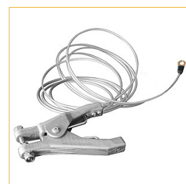
Cable Antiestática incluido