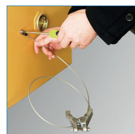
Cable Antiestática no incluido