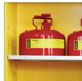
Bandejas regulables con soportes soldados