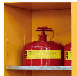
Bandejas regulables con soportes soldados