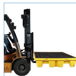
Compatible con grúas horquillas