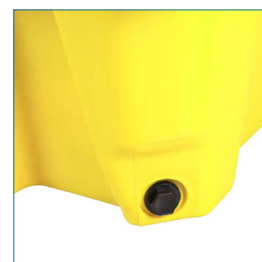
Incluye tapón de drenaje hexagonal para facilitar el drenaje