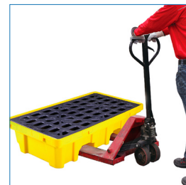
Compatible con carros transpaletas