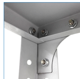
Escuadra de refuerzo en vértices