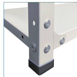
Pies con cubierta protectora