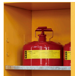
Bandejas regulables con soportes soldados