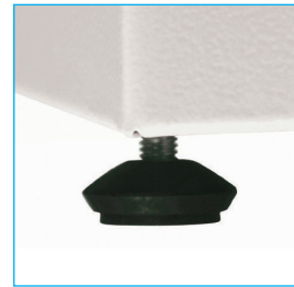
Pie elevador regulable