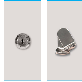
Llave escritorio - Porta candado