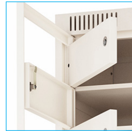
2 cerraduras generales para apertura total