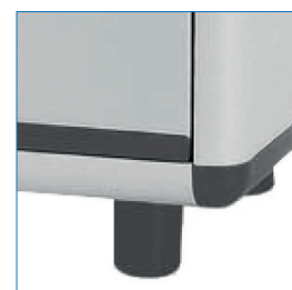
4 soportes en base