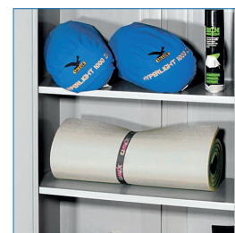
2 Bandejas ( 20 kg max. carga uniforme )