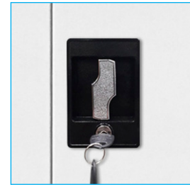
Cerradura tipo españoleta

* Artículos de fotografía sólo para efectos demostrativos. No incluidos con el producto.