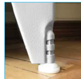
Pie de altura ajustable