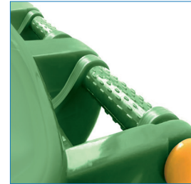
Mango antideslizante, cubierta de 4 bisagras