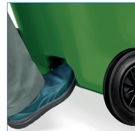
Borde de apoyo para dar inclinación