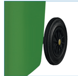
2 Ruedas traseras