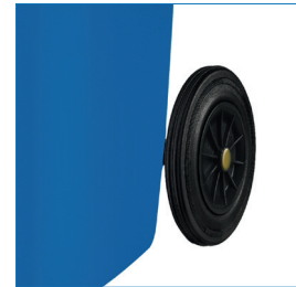
2 Ruedas traseras