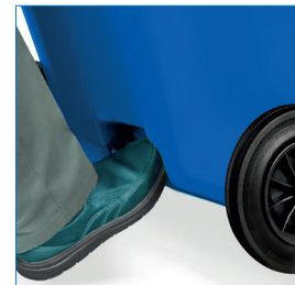
Borde de apoyo para dar inclinación