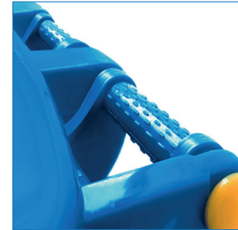
Mango antideslizante, cubierta de 4 bisagras