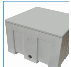
Tapa: Bipared apilable