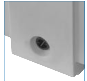
Desagüe opcional de 2"