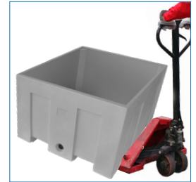
2 entradas, para grúa horquilla y transpaleta