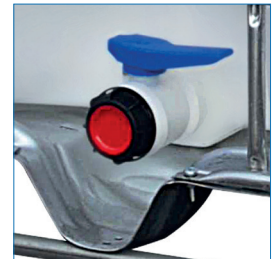
Válvula descarga de bola soldada de 2" de polietileno con hilo exterior.