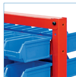
Estantería acero galvanizado