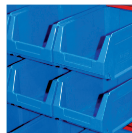
Gavetas polipropileno (PP)