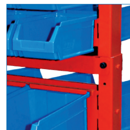
Estantería acero galvanizado