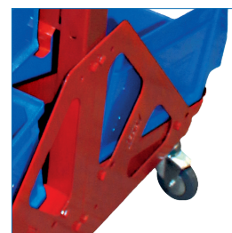
Ruedas con seguro de fijación.