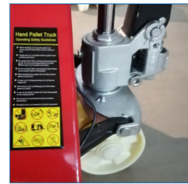
2 Ruedas direccionales con eje rotatorio.