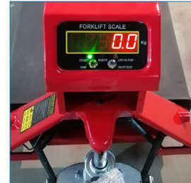
Pantalla digital, batería Litio incluida.