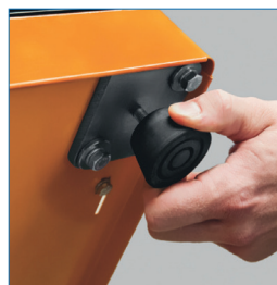
Pies de ajuste de altura para compensar las irregularidades del suelo.

* Artículos de fotografía sólo para efectos demostrativos. No incluidos con el producto.