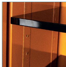
Bandejas móviles para diferentes configuraciones