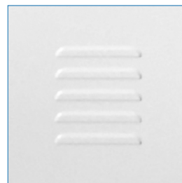
Celosía disponible en cada puerta