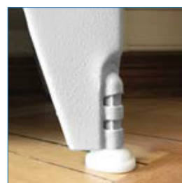
Pie de altura ajustable