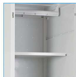
Barra colgadora - Bandeja