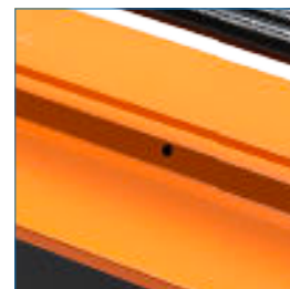
Orificio para candado