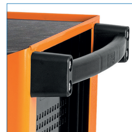
Tirador ergonómico y revestido de goma