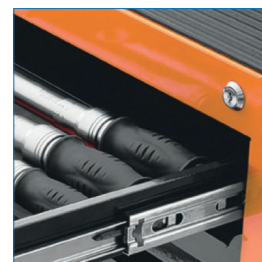
Traba para los cajones y puertas