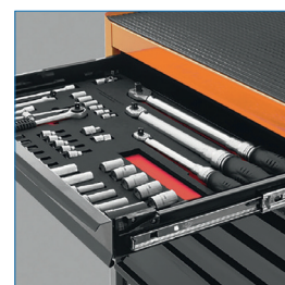
Rieles telescópicos que garantizan mayor apertura y sistema especial de traba de cajones

* Artículos de fotografía sólo para efectos demostrativos. No incluidos con el producto.