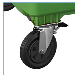
4 Ruedas con seguro de fijación, eje giratorio.