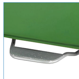
OPCIONAL: Pedal frontal de apertura.