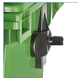
Barra para sistema de elevación, Manillas laterales.