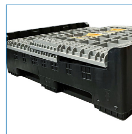
Pallet desarmado, Alto 36 cm.