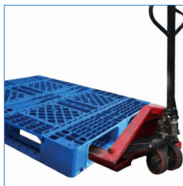
4 entradas grúa horquilla