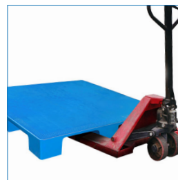
4 entradas grúa horquilla y transpaleta