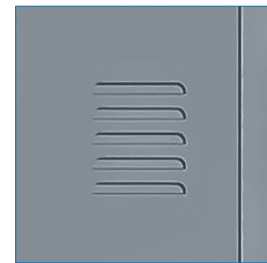
Celosía disponible en cada puerta

* Artículos de fotografía sólo para efectos demostrativos. No incluidos con el producto.