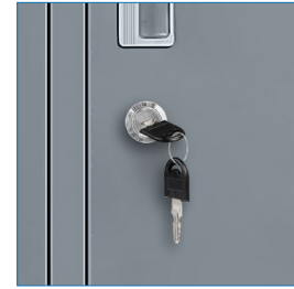
Cerradura llave escritorio