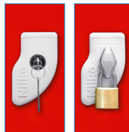
Llave escritorio - Porta candado (Candado diámetro entre 6 a 8 mm.)