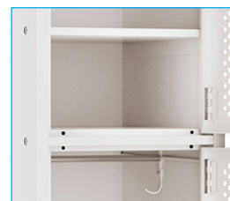
Barra colgadora - Colgador - Bandejas