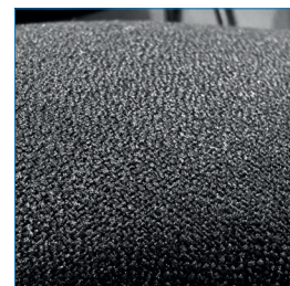
Asiento y respaldo acolchados