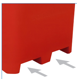
Entradas grúa horquilla o transpaleta