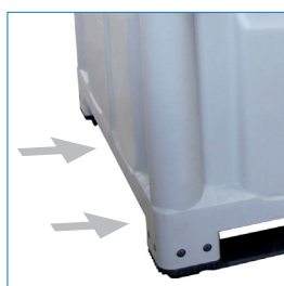
Entradas grúa horquilla y 2 transpaleta