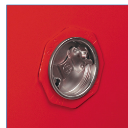
Respiradores para reducir concentración de sustancias volátiles