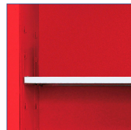
Bandejas regulables con soportes soldados